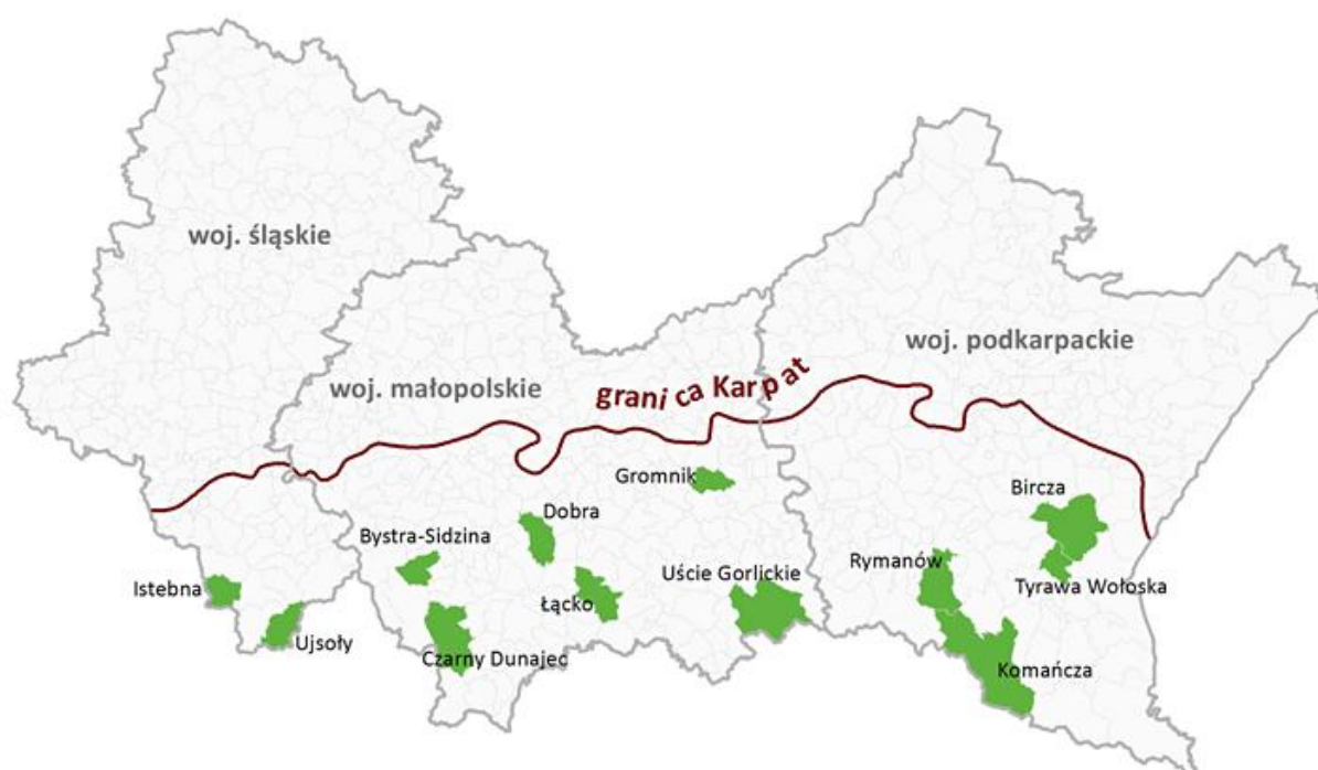
Ryc. 1. Wybrane gminy, w których realizowane były warsztaty promujące rozwój działalności gospodarczej przyjaznej środowisku.

Warsztaty dotyczące rozwoju gospodarki przyjaznej środowisku przeprowadzono w 12 gminach położonych w regionie polskich Karpat (patrz ryc. 1.)