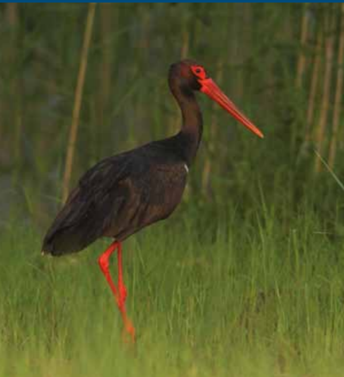
Bocian czarny Ciconia nigra – jeden z karpaccich gatunków, dla zachowania których wyznacza się obszary specjalnej ochrony ptaków.

Ochrona przyrody w ramach sieci Natura 2000 skupia się tylko na wybranych gatunkach i siedliskach występujących na poszczególnych obszarach (tzw. przedmiotach ochrony).