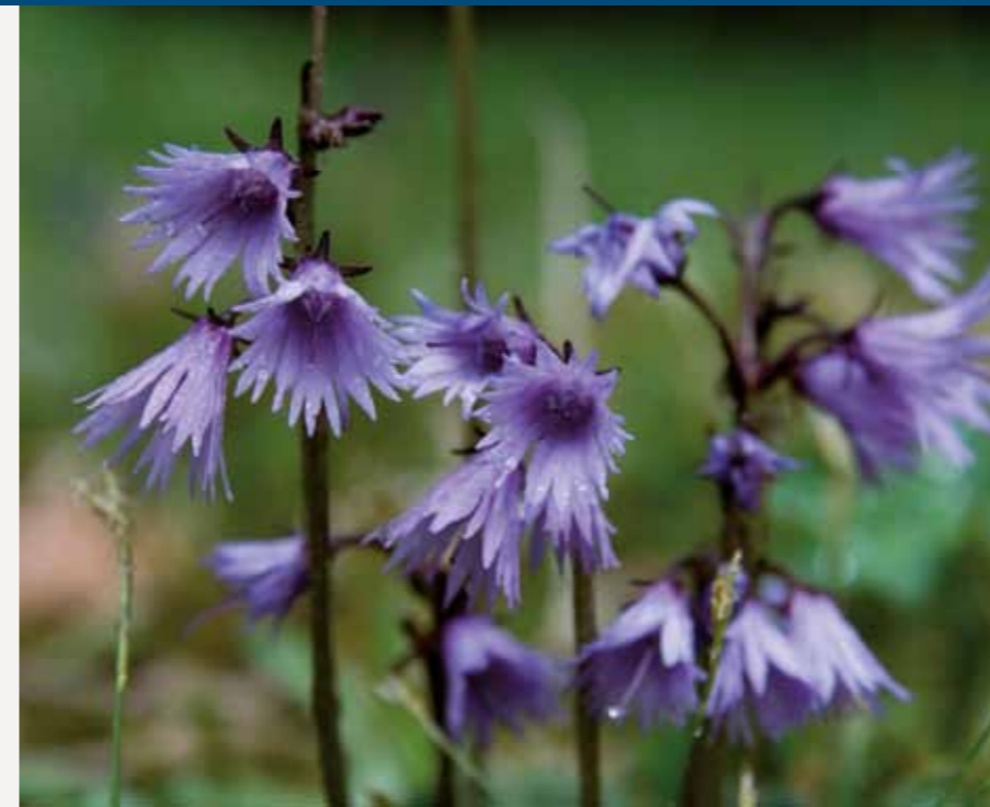
Urdzik karpaccy Soldanella carpatica to endemit niespotykany nigdzie indziej poza Karpatami Zachodnimi. Wyznaczanie specjalnych obszarów ochrony siedlisk zapewnia m.in. ochronę gatunkom roślin, takich jak urdzik karpaccy. Fot. Tomasz Wilk

Wypas owiec przyczynia się do zachowania karpaccich siedlisk przyrodniczych związanych z ekstensywną gospodarką rolną. Barwna odmiana owcy rasy polska owca górską podlega ochronie. Hodowcy tych zwierząt po przystąpieniu do programu rolnośrodowiskowego mogą otrzymywać dopłaty. Fot. Tomasz Wilk